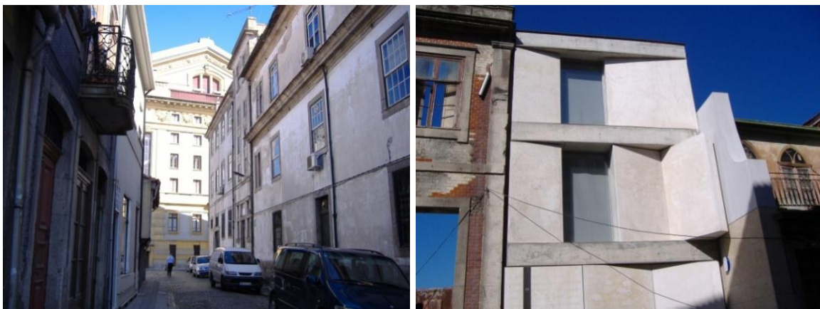
Figura 7. Casa demolida deu lugar a edifício novo do Teatro Nacional de S. João, rua da Porta do Sol

A empresa de Tsing não era uma empresa familiar, embora nela trabalhassem também a esposa e o filho. A mão de obra era constituída, em grande parte, por empregadas portuguesas, muitas delas a trabalhar à peça, no seu domicílio. Era uma empresa que confeccionava gravatas de seda com matéria-prima portuguesa e não importada da China, país da seda, porque nessa altura, no Império do Meio, vivia-se um período de grande instabilidade política, social, económica.