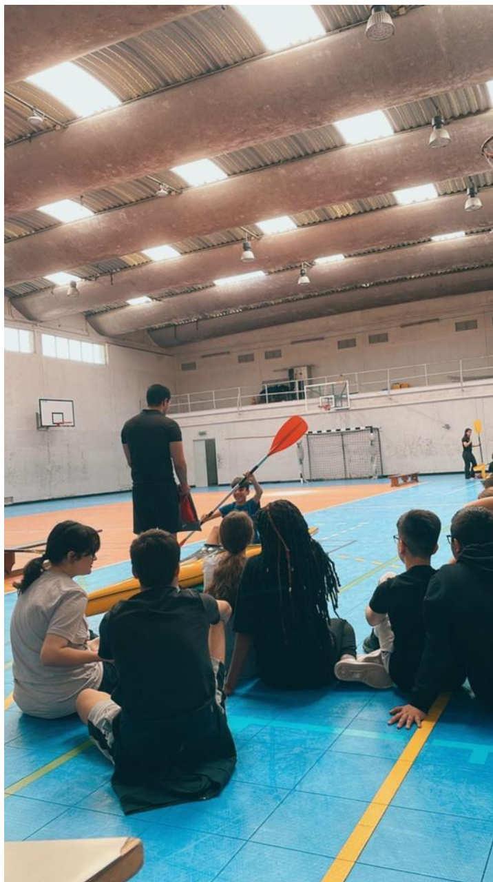
4 Kayak Vem à Escola