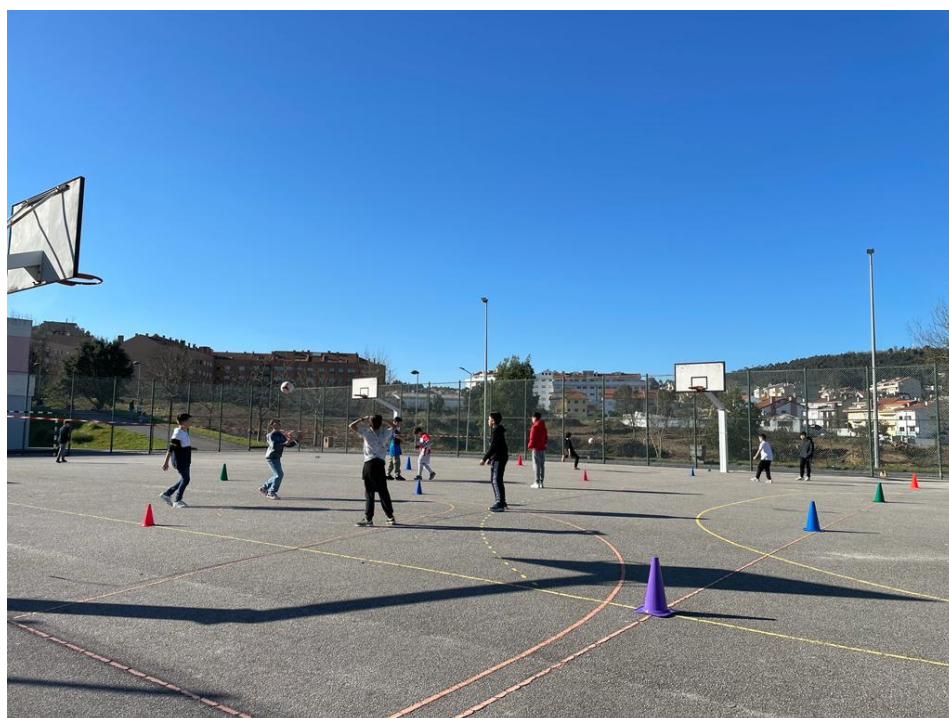
7 Dia Mundial da Criança