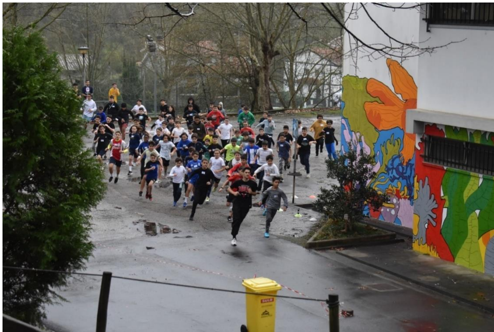
2 Corta Mato Escolar