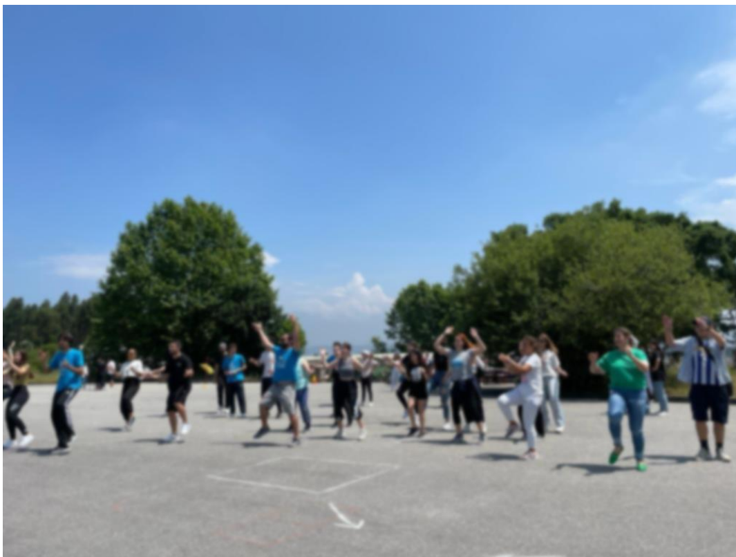
3 Dia Mundial da Dança