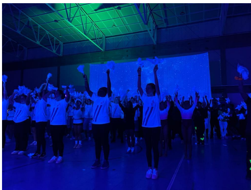
6 Sarau Desportivo 2023