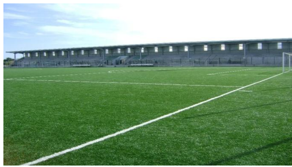
Figura III – Complexo Desportivo de Lavra