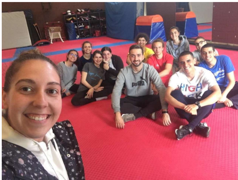
Figura 8 - Turma do 11ª