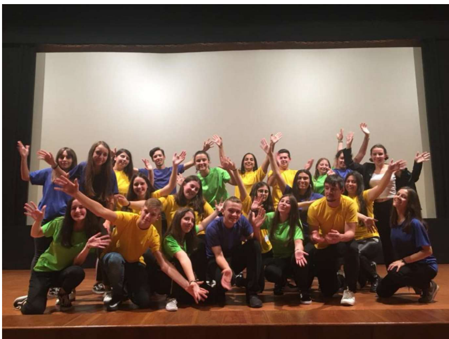
Figura 3 - Atividade de Erasmus