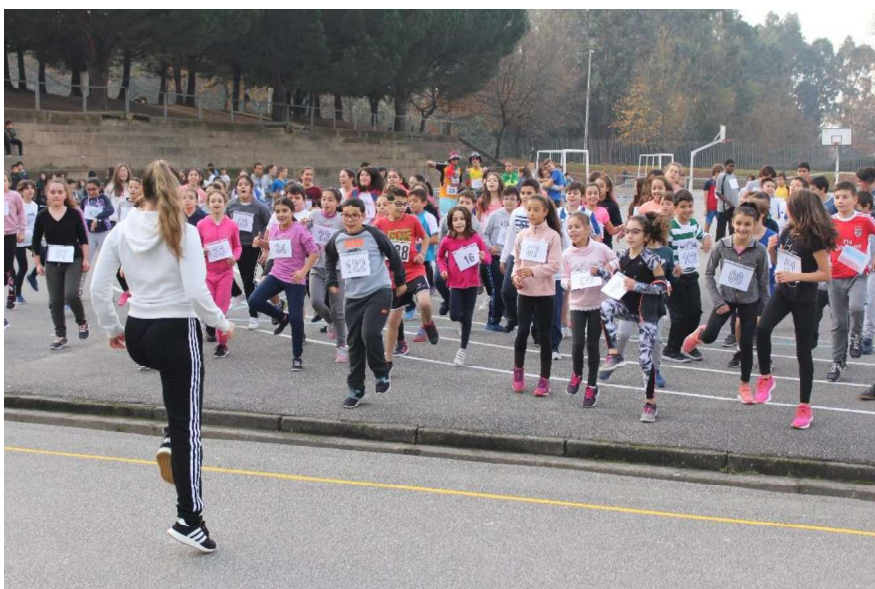
Figura 4 - Aquecimento do Corta Mato