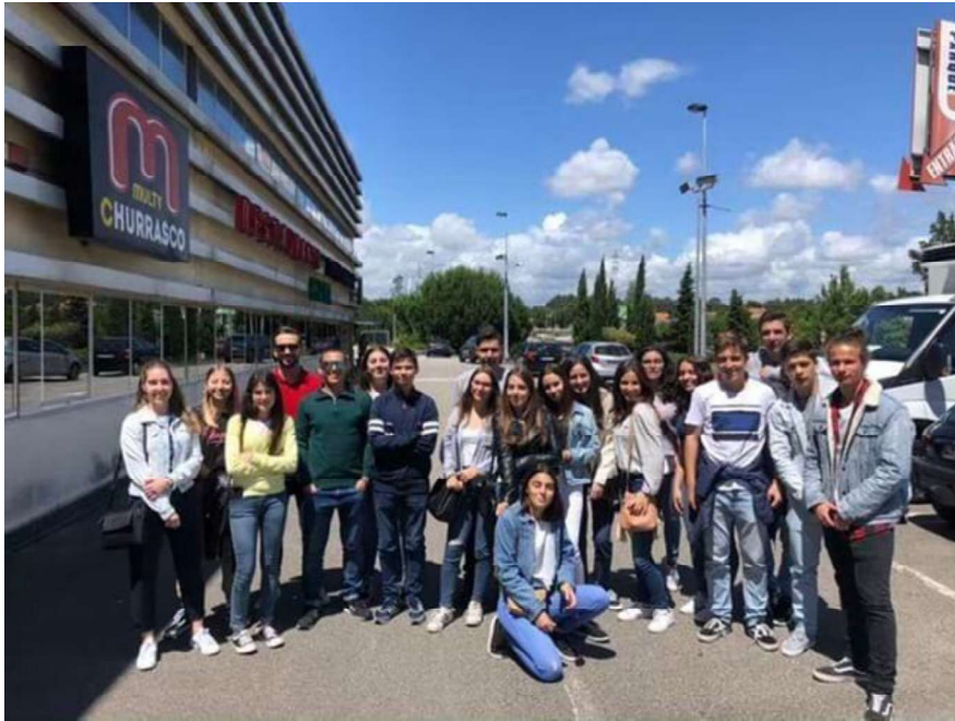
Figura 9 - Turma do 11ºB