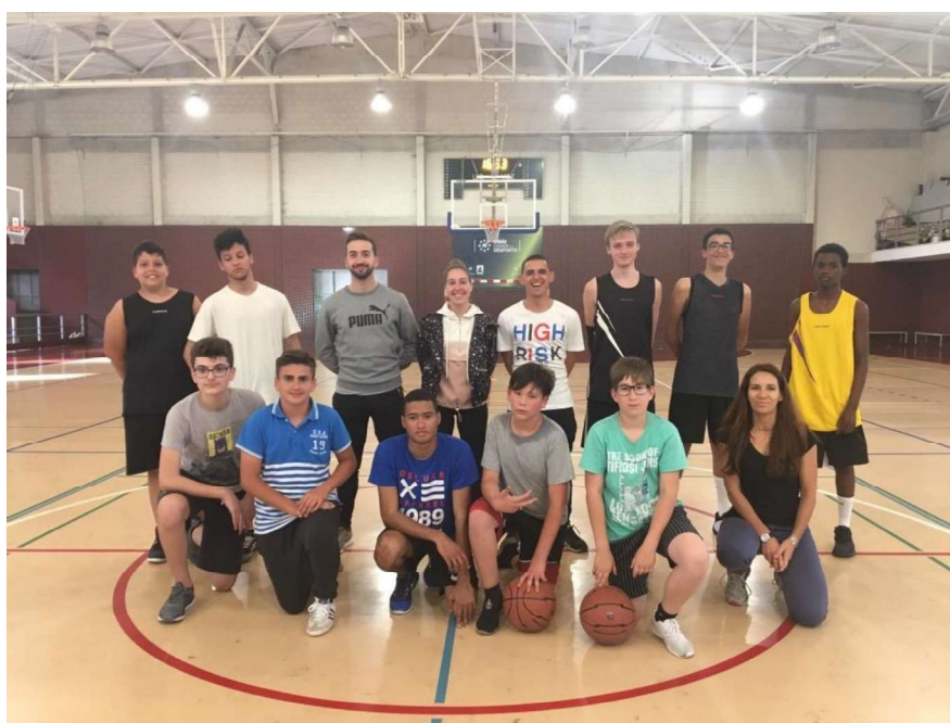
Figura 6 - Grupo Equipa do DE