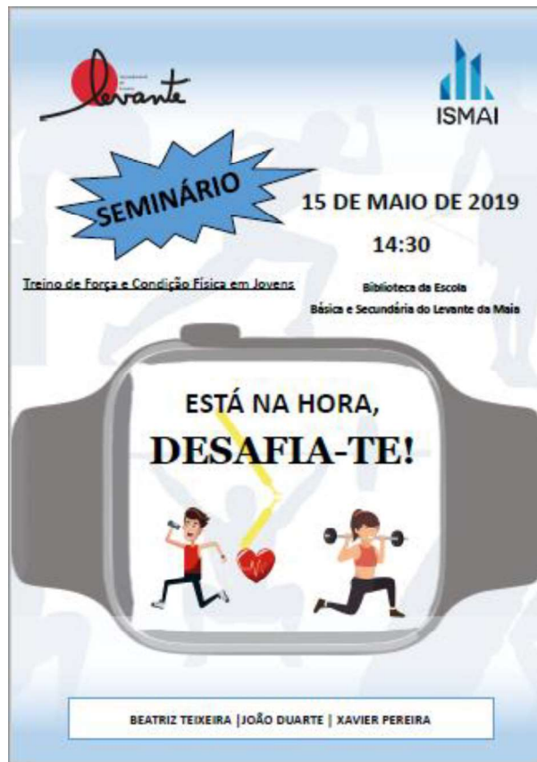
Figura 7 - Cartaz do Seminário