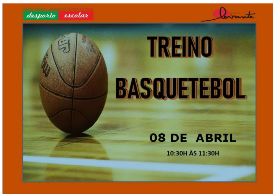
Figura 5 - Cartaz do Treino de Férias do DE