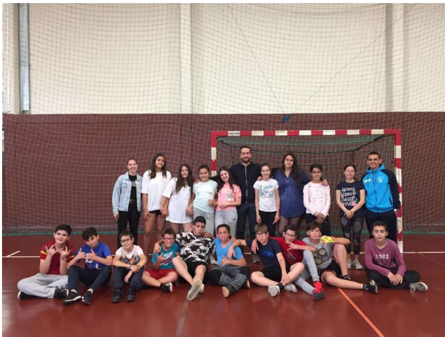
Figura 10 - Turma do 6ºD