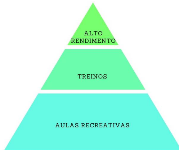
Figura 2 - Estrutura Organizacional do Projeto