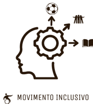
Figura 1 - Logotipo do Projeto

Atualmente, tudo pode ser vendido com recurso a uma boa publicidade. Por isso, criamos um logotipo, como podemos observar na Figura 1, para que o nosso projeto possa ser reconhecido por todos que com ele deparem. Por outro lado, compreendemos a importância da flexibilidade e da integração visual nos diversos municípios que, futuramente, possam abraçar esta iniciativa. Desenvolvemos uma versão monocromática deste logotipo, permitindo que, desta forma, este seja personalizado com as cores específicas de cada município. Assim, cada autarquia pode adaptar o projeto de forma única, sem que a marca perca a sua identidade.