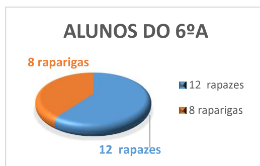
Figura 2. Número de alunos 6ºA

Quanto à oferta desportiva nas proximidades, de acordo com o levantamento efetuado, existe ainda uma percentagem pequena de alunos que praticam desporto federado, exercício físico ou atividade física por lazer. Sendo que Valongo é