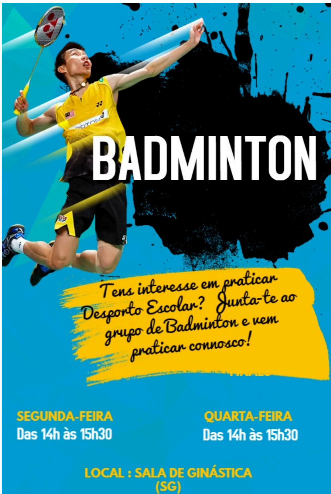
Figura 7 - Cartaz Promoção da modalidade de Badminton no âmbito do Desporto Escolar