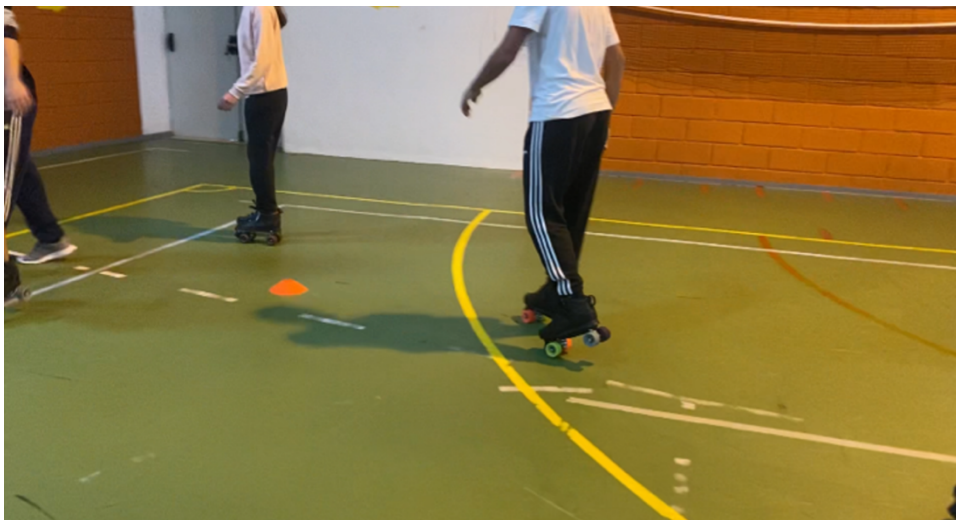
Figura 9 - Evento Patinagem