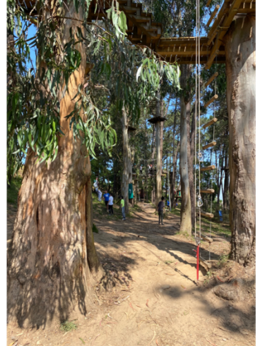
Figura 13 - Visita de estudo ao Azurara Parque Aventura, em Vila do Conde.