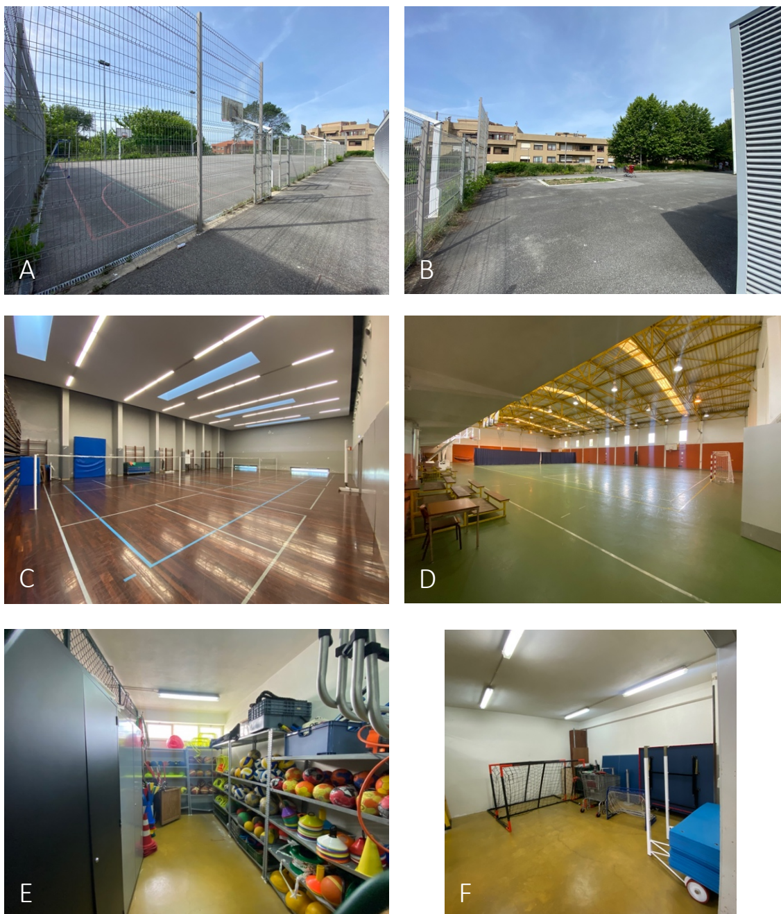
Figura 1 – Instalações e material desportivo da Escola Secundária Inês de Castro (ESIC). A) Espaço exterior com tabelas de basquetebol e balizas; B) Pista de 40m e caixa de areia; C) Pavilhão Gimnodesportivo; D) Pavilhão Desportivo; E) Material desportivo; F) Material desportivo