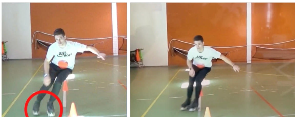
Figura 12 – Frames relativos ao vídeo “Cruzamento de Saberes”