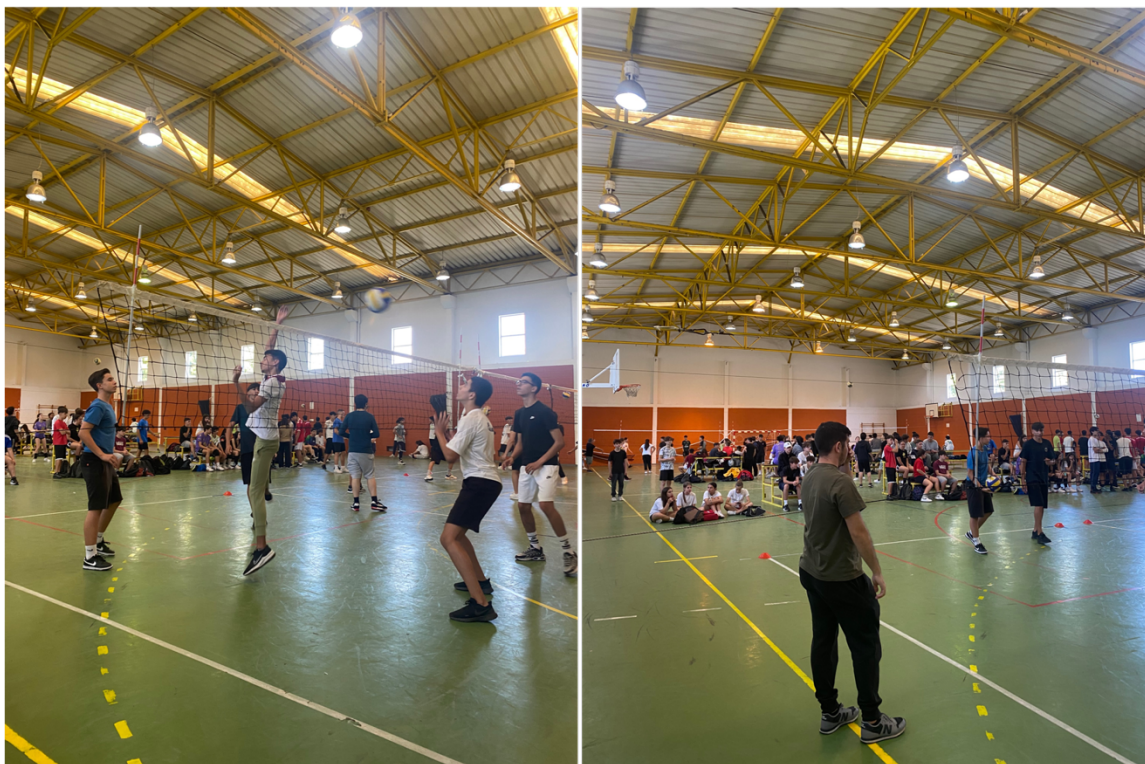
Figura 6 - Torneio de Voleibol