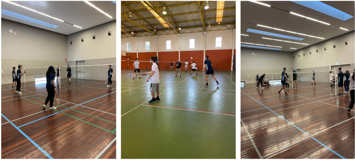
Figura 8 – Torneio de Badminton no âmbito do Desporto Escolar