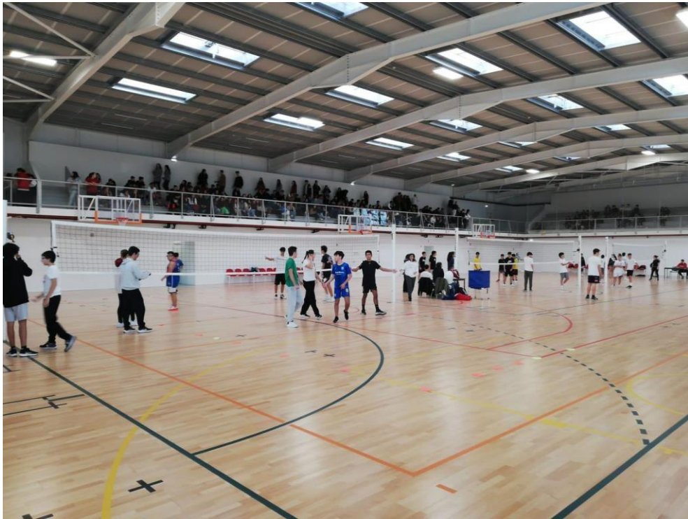
Figura 9 - Torneio de Voleibol ESEQ