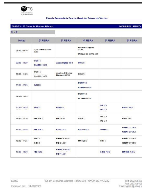
Figura 2 - Horário do NPES