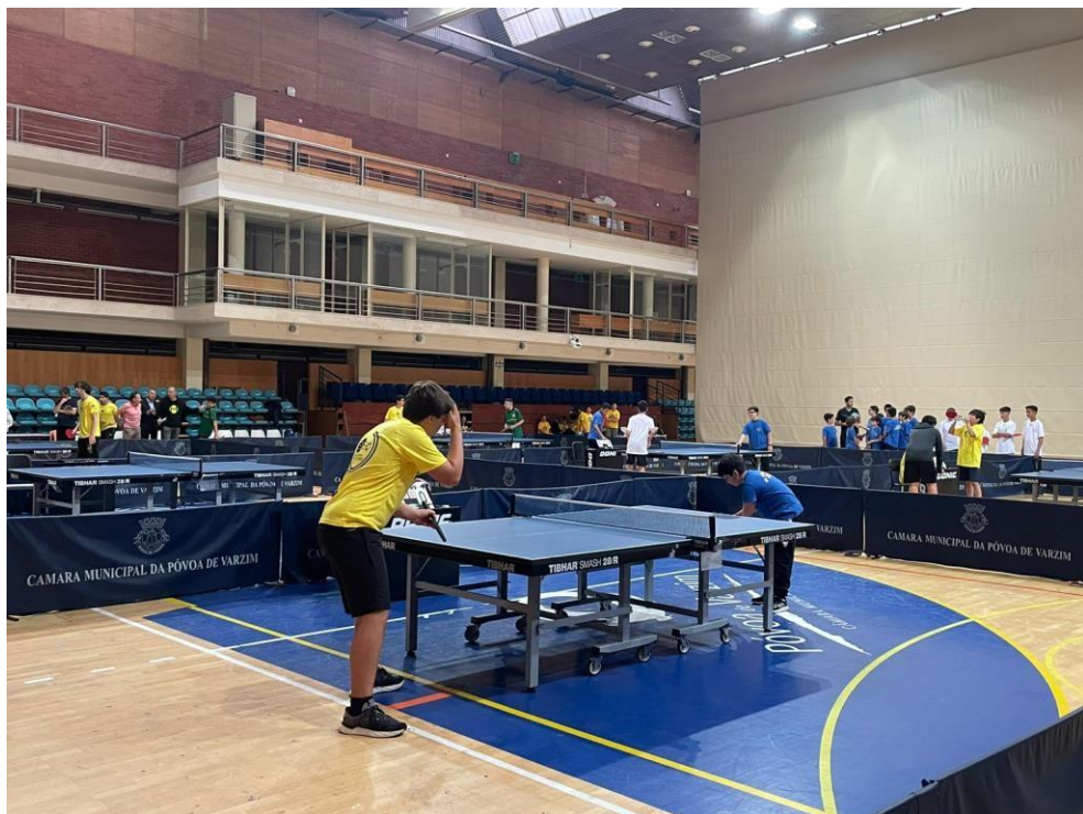
Figura 10 - Jogos Desportivos Municipais Ténis de Mesa