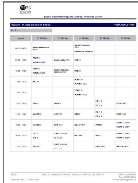
Figura 1- Horário Turma 9ºB